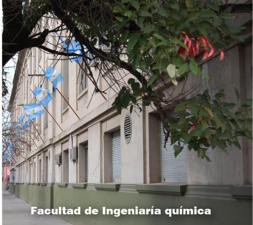
Facultad de Ingeniería química