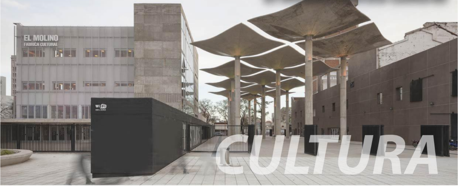
El Molino fábrica cultural