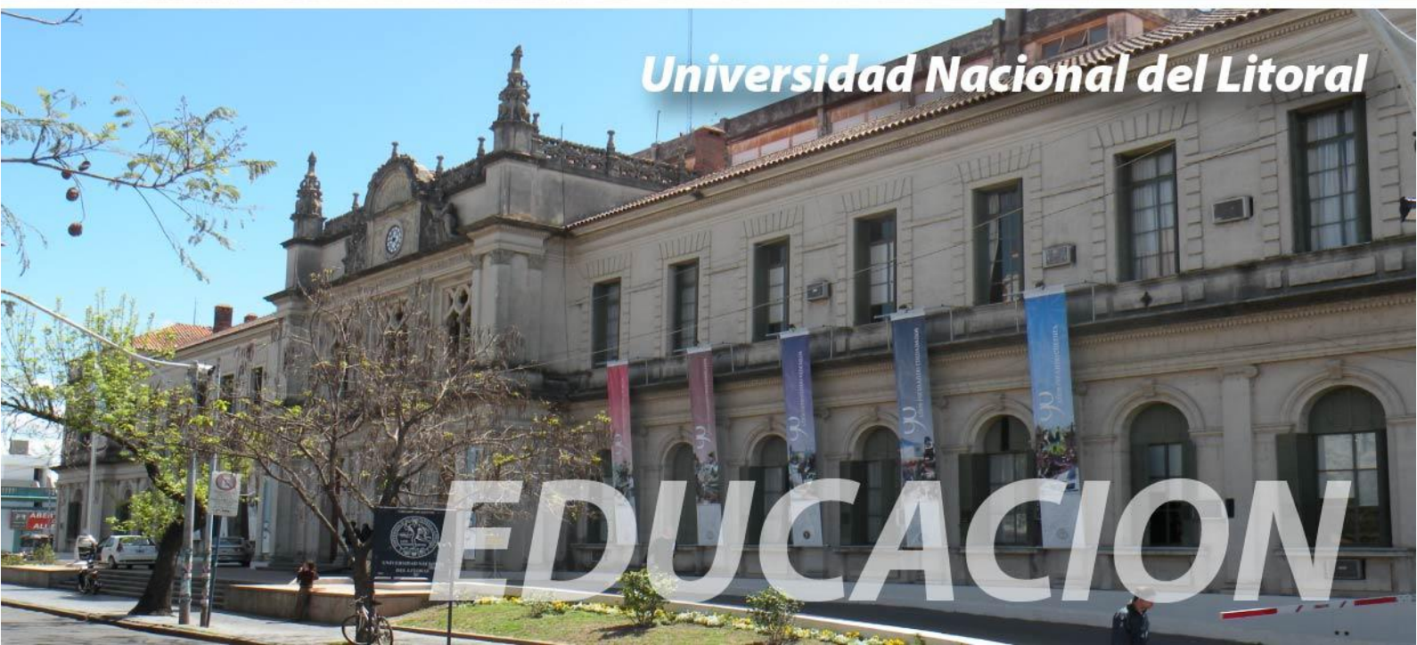
Universidad Nacional del Litoral